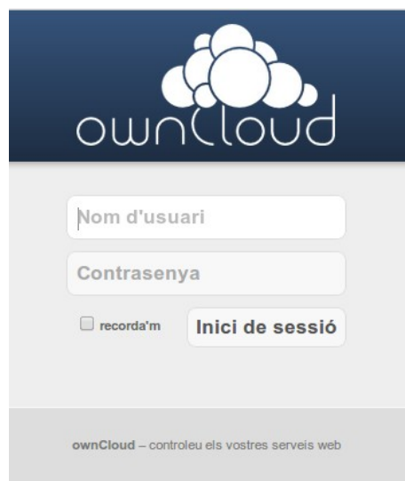
Inici de sessió d'usuari via web