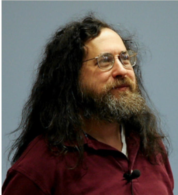
Figura 2: Richard Stallman

Richard Matthew Stallman , sovint conegut per les inicials RMS , és un programador i activista estatunidenc, fundador del projecte GNU (1983) i de la Free Software Foundation (1985). És l'autor de l'anomenat "manifest GNU" i el principal redactor de la Llicència GPL .