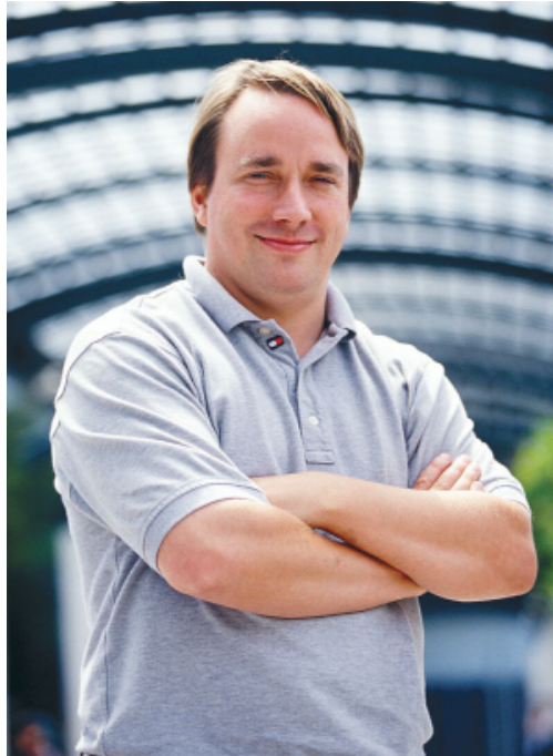
Figura 3: Linus Torvalds

Linus Benedict Torvalds és un enginyer de programari finlandès, creador del nucli Linux . El 1991, sent encara estudiant a la Universitat de Hèlsinki, va començar a desenvolupar aquest nucli com a projecte personal, inspirant-se en Minix , un sistema operatiu acadèmic de tipus Unix.